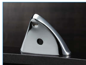
10,16 cm centre (4 po) centre à centre