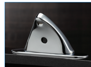
20,32 cm (8 po) centre à centre

Modèles disponibles avec un approvisionnement double et un mitigeur mécanique ou un mitigeur thermostatique pour la protection contre les brûlures. Disponible également en approvisionnement unique.